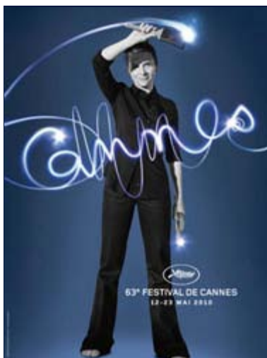
Zvaničan promo poster 63. Filmskog festival u Kanu (Copyright © Brigitte Lacombe – grafički dizajn Annick Durban)

Srbije kao filmske lokacije, među kojima su producerske kuće Art and Popcorn, Work in Progress, Red Production, PFI studija i filmska laboratorija Cinelabs, boravili su u Kanu gde su održali veliki broj sastanaka sa rediteljima i producentima iz Engleske, Francuske i SAD zainteresovanim za snimanje u Srbiji.