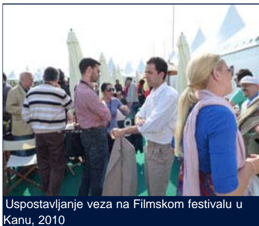
Uspostavljanje veza na Filmskom festivalu u Kanu, 2010

KAN – Francuska – U proteklih devet meseci, inostrani producenti posetili su Srbiju tražeći lokacije za projekte u ukupnoj vrednosti od 360 miliona dolara, dok su u toku pregovori za projekte u iznosu od oko 100 miliona dolara koji bi se realizovali u naredne dve godine. Ovo dokazuje povećano interesovanje za Srbiju kao lokaciju za snimanje filmova od strane međunarodnih producenata što je posebno bilo iskazano na ovogodišnjem Kanskom festivalu.