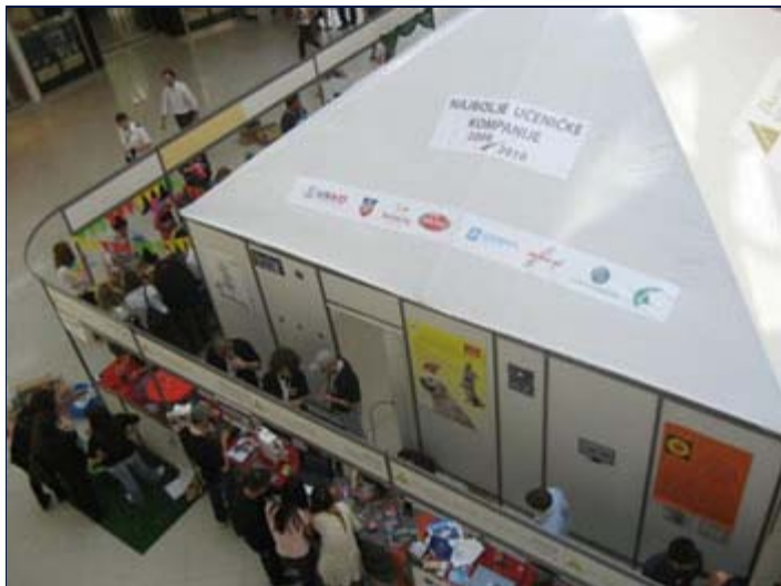
Nacionalno takmičenje učeničkih kompanija održano je u beogradskom tržnom centru „Delta City“.

BEOGRAD – Troje tinejdžera, menadžera učeničke kompanije „Junior Vision“, krenulo je 24. maja iz svog rodnog Arilja da bi se u Beogradu takmičili na Sajmu učeničkih kompanija. Već su tada znali da su među pobednicima. Oni su se kvalifikovali među najboljih 20 učeničkih kompanija koje su dobile priliku da učestvuju na jednom od najvažnijih takmičenja u oblasti omladinskog preduzetništva u Srbiji. Po okončanom takmičenju našli su se na samom vrhu, osvojivši titulu Najbolje učeničke kompanije u 2010. godini.