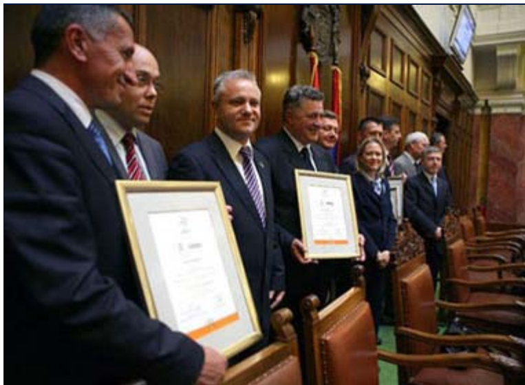
Gradonačelnici ponosno prikazuju svoje certifikate o povoljnom poslovnom okruženju.

BEOGRAD - Nacionalna alijansa za lokalni ekonomski razvoj (NALED) je, uz podršku USAID Programa podsticaja ekonomskom razvoju opština, organizovala drugu svečanu ceremoniju dodele certifikata za pet opština sa povoljnim poslovnim okruženjem 8. juna 2010. u Domu Narodne skupštine u Beogradu. Svečanosti su prisustvovali potpredsednik Vlade Mlađan Dinkić , ministar Milan Marković , ambasadorica SAD u Srbiji Meri Vorlik , kao i ambasadori Izraela, Kanade i Austrije . Opštine koje su ispunile zahtevne kriterijume neophodne za dobijanje ovog prestižnog certifikata su Bujanovac, Leskovac, Piroć, Subotica i Vranje, dok su Inđija, Kragujevac i Loznica ovaj certifikat dobile 2008. godine. U procesu sertifikacije trenutno se nalazi još 18 gradova i opština.